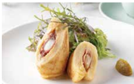
常滑たまごの里 デイリーファーム直送 名古屋コーチン卵と生ハムチーズ入りのフレンチトースト