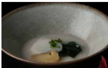
牛骨と松茸のスープ “コムタン”